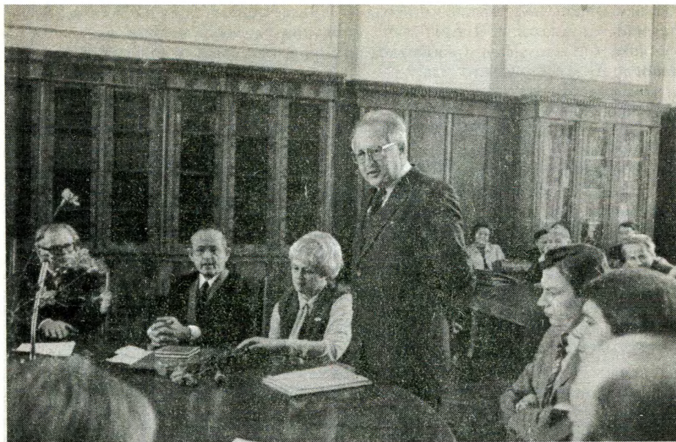
Вручение диплома почетного доктора МГУ А. Соболю. 1982 г.

хозяйном. В его квартире на улице Нотр Дам де Шан ("Богородицы в полях") часто собирались интересные люди, в том числе историки левого направления из разных стран: англичане Джордж Рюде и Ричард Кобб, итальянец Армандо Саятта, немец Вальтер Марков и, конечно, Анатолий Адо. Бывали там Б.Ф. Поршнев, А.З. Манфред и другие советские историки, а также французские историки-марксисты более молодого поколения: Мишель Вовель, Клод Мазорик, Ги Лемаршан.